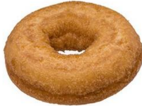
(minimum viable product)